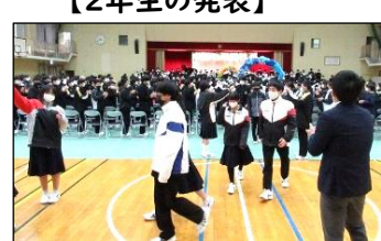
【アーチをくぐって退場です】