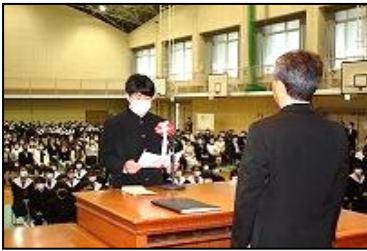
【宣誓(神島田小卒業生)】

新入生宣誓や新入生代表挨拶では、学習や部活動等を頑張っており、新しい仲間と楽しく過ごしていきたいという、前向きな内容が発表されました。今の気持ちを忘れずに、頑張りたいと思います。