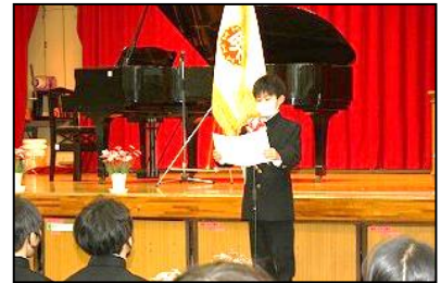
【代表挨拶(南小卒業生)】

新入生宣誓や新入生代表挨拶では、学習や部活動等を頑張っており、新しい仲間と楽しく過ごしていきたいという、前向きな内容が発表されました。今の気持ちを忘れずに、頑張りたいと思います。