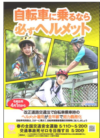
【愛知県作成のポスター】

暁中学校の生徒を始め、保護者の皆様方、地域の皆様方が、安全第一で過ごすことができるよう願っています。