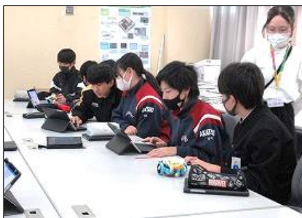
【あれこれ、試行錯誤、、、う〜ん】

このような活動・学習を通して、自分なりの新しい考え方や捉え方によって、解決策を構想しようとする態度や、自らの問題解決とその過程を振り返り、より良いものとなるよう改善・修正しようとする態度を身に付けてくれることを願っています。